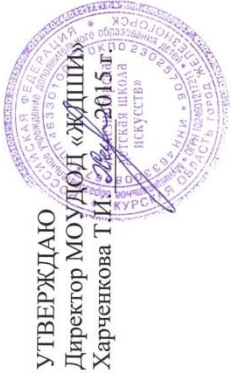
График образовательного процесса